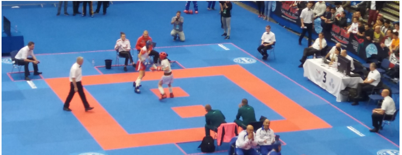
Exemple tatami compétition WAKO kick light